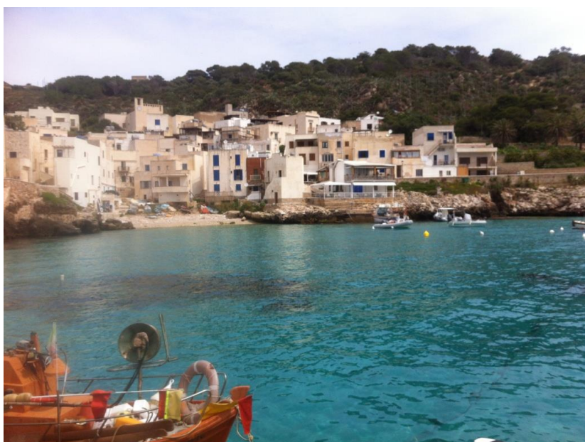
(Fig. 7b) Spiaggia dell'isola di Levanzo