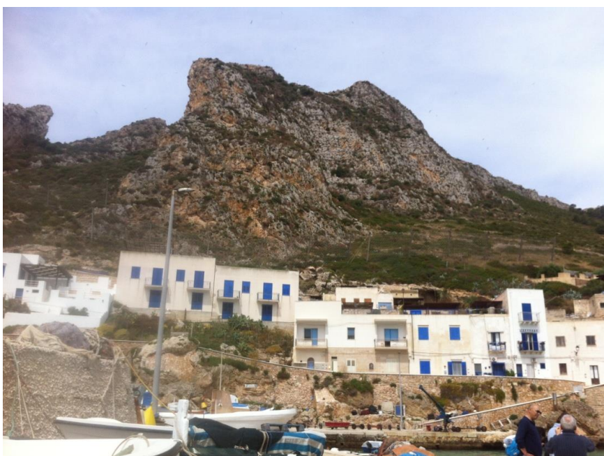
(Fig. 7a) Veduta dell'isola di Levanzo

Dopo aver fotografato numerose volte l'acqua cristallina del porto, circondata da uno splendido paesaggio a terrazze, siamo ripartiti alla volta di Favignana.