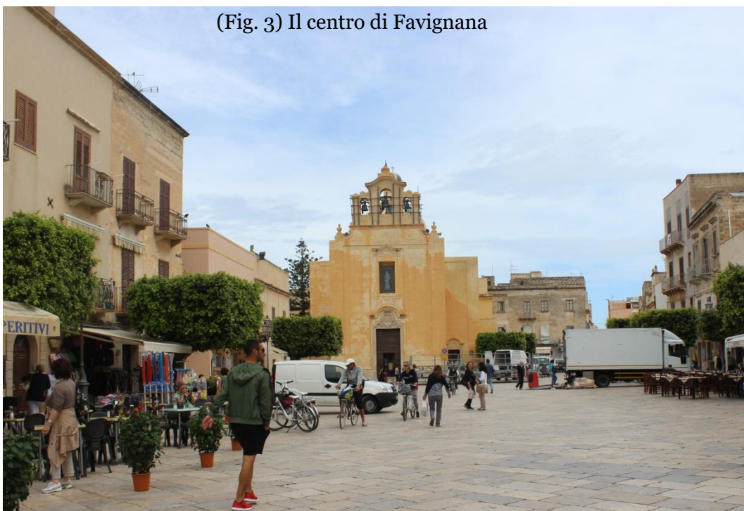
(Fig. 3) Il centro di Favignana

Durante la traversata abbiamo scorto le reti che delimitano la tonnara, segnalate dalla presenza di due barche di colore giallo e da numerose boe dello stesso colore posizionate ad intervalli regolari, illuminate da faretto per consentirne la visione notturna. Gli skipper ci hanno aiutato a timonare la barca e mostrato praticamente le manovre con cime e vele. A causa della mancanza di vento abbiamo dovuto ormeggiare la barca rientrando di poppa(Fig. 3 ).