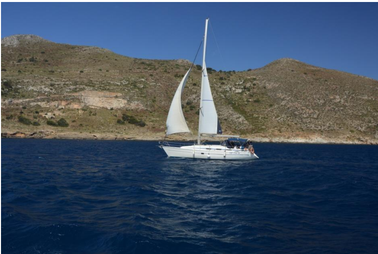
(Fig. 2 a ) La Niña